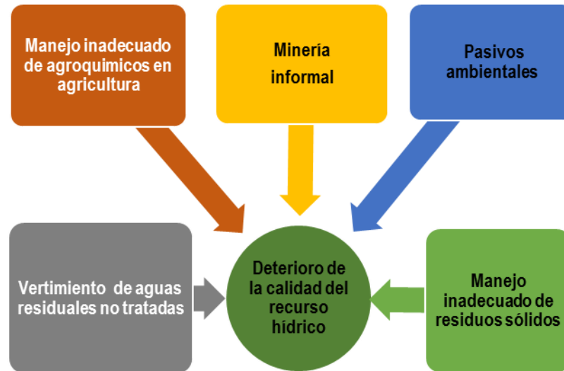
Figura N°1. Factores antropogénicos que afectan las fuentes de agua